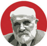
Altiero Spinellego (1907-1986)

Przejęcie kompetencji w dziedzinie edukacji i wychowania realizuje wizję komunisty Altiero Spinellego, zakładając ostateczną likwidację suwerennych państw narodowych. Utworzenie wspólnego państwa europejskiego jest możliwe dzięki odpowiednio uformowanym kolejnym pokoleniom.